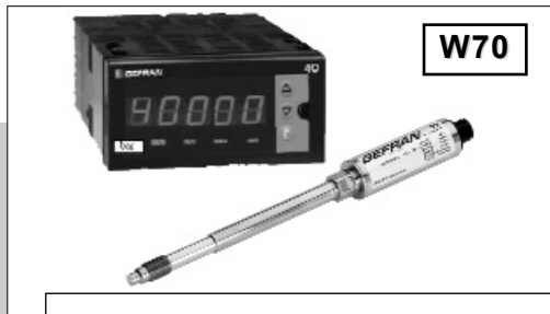
硬杆组态使安装方便快捷