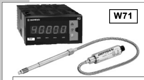
软杆组态用于要求更高热隔离或难以安装场合